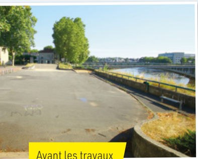
Avant les travaux

Bowl, curbs, handrails... Si pour vous, ces mots relèvent du charabia, c'est que vous ne fréquentez pas assez le skatepark de Châtelleraut ! Rattrapez-vous avec notre quizz.