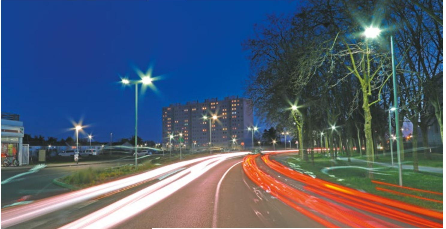
L'éclairage à LEDs a pris ses quartiers à Ozon.

Énergie, économie et climat sont intrinsèquement liés. Voici trois actions concrètes mises en œuvre à Châtelleraut pour que particuliers et collectivités atténuent leur empreinte énergétique. Avec, à la clé, des gains financiers.