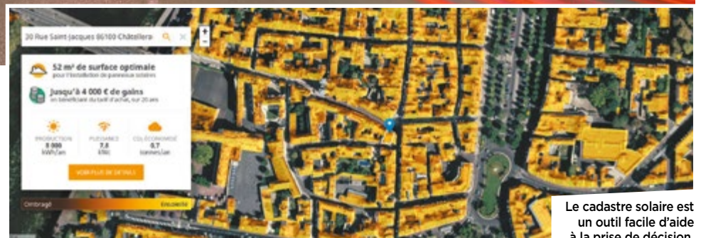
Le cadastre solaire est un outil facile d'aide à la prise de décision.