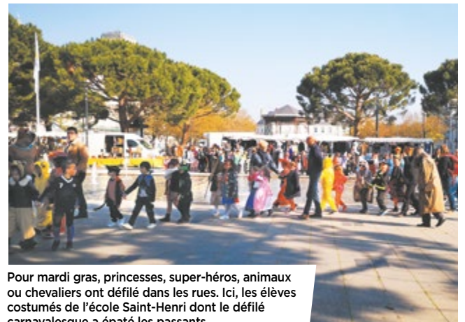
Pour mardi gras, princesses, super-héros, animaux ou chevaliers ont défilé dans les rues. Ici, les élèves costumés de l'école Saint-Henri dont le défilé carnavalesque a épaté les passants.

Bimensuel d'informations de la Ville de Châtelleraudais - Hôtel de ville - BP 619 - 78, boulevard Blossac 86106 Châtelleraudais Cedex - Courriel : le-chatelleraudais@ville-chatelleraudais.fr