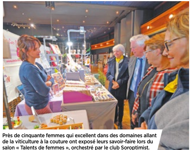
Près de cinquante femmes qui excellent dans des domaines allant de la viticulture à la couture ont exposé leurs savoir-faire lors du salon « Talents de femmes », orchestré par le club Soroptimist.

Maire de Châtelleraudais, Président de Grand Châtelleraudais