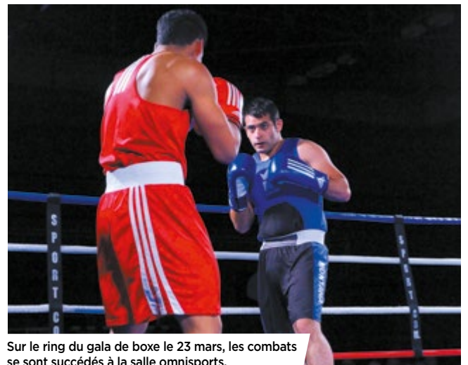
Sur le ring du gala de boxe le 23 mars, les combats se sont succédés à la salle omnisports.