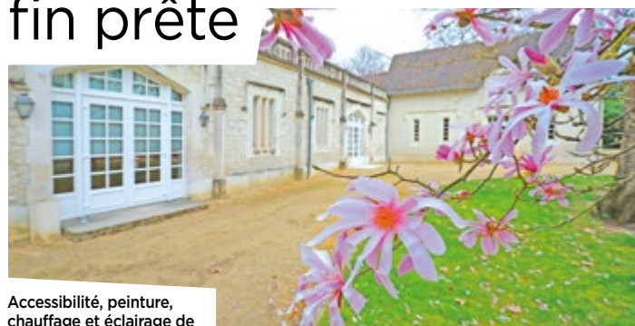
Accessibilité, peinture, chauffage et éclairage de cet équipement très utilisé ont été améliorés.