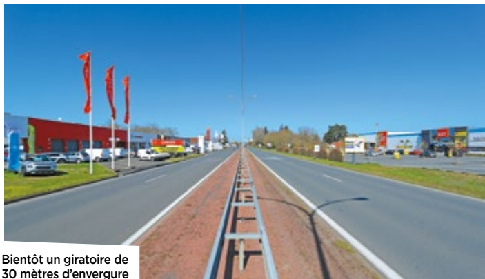
Bientôt un giratoire de 30 mètres d'envergure