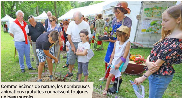
Comme Scènes de nature, les nombreuses animations gratuites connaissent toujours un beau succès.