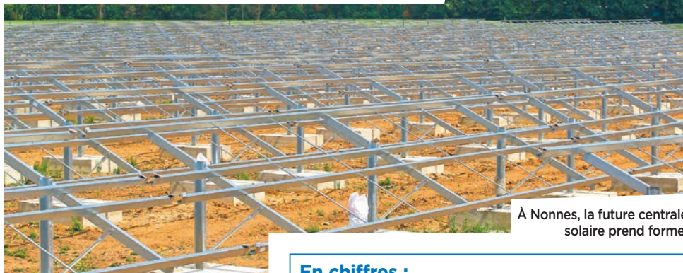
À Nonnes, la future centrale solaire prend forme.

L'exploitation de ce parc solaire a été confiée à Engie Solar. Il est implanté sur le terrain d'anciennes gravières des années 1950, devenues ensuite une décharge. Le site a connu une importante phase de réhabilitation, menée en lien avec les services de la Ville. Des travaux de terrassement ont notamment été réalisés en début d'année. Ils ont nécessité