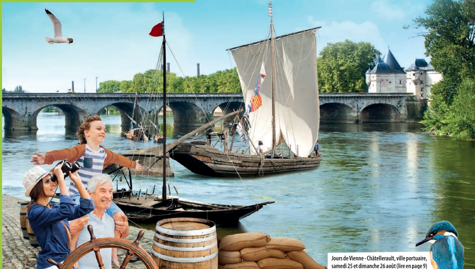
Jours de Vienne - Châtellerauld, ville portuaire, samedi 25 et dimanche 26 août (lire en page 9)

À la faveur de chaleurs bercées de douces senteurs estivales, l'art vivant prend l'air, le sport sort dans la rue, la ville est le théâtre de concerts en plein air. Châtellerauld est sur la ligne de départ pour fêter l'été.