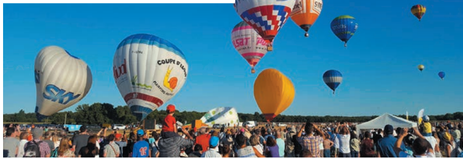
GRATUIT - Aérodrome de Châtelleraut-Targé

Frisson garanti ! Le vendredi à 20h30, la fanfare Big Joana fera monter la température. Le samedi, un marché semi-nocturne précèdera un spectacle de night glow : un show sonore où des lumières viennent parer les ballons lestés au sol.