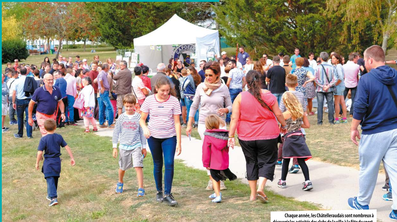
Chaque année, les Châtelleraudais sont nombreux à découvrir les activités des clubs de la ville à la fête du sport.