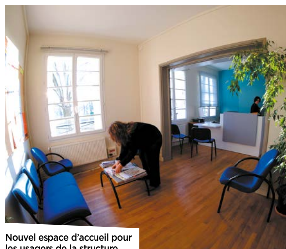
Nouvel espace d'accueil pour les usagers de la structure