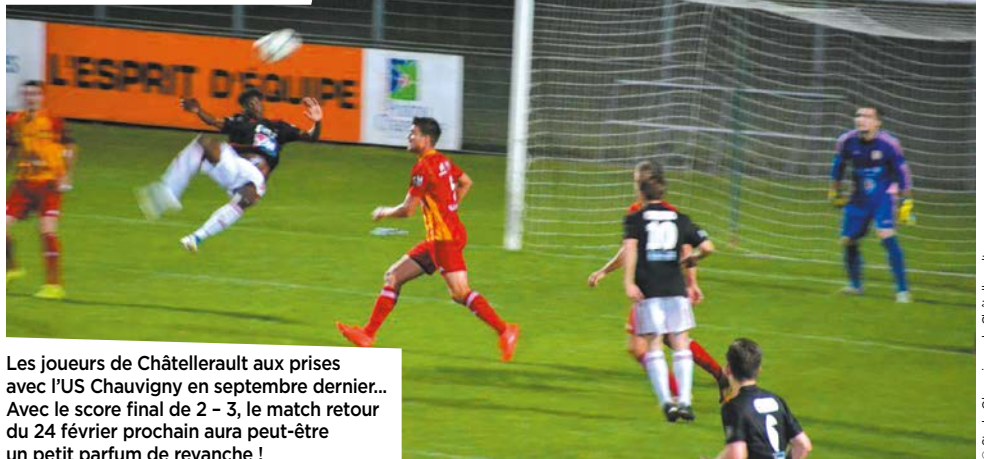
Les joueurs de Châtellerauld aux prises avec l'US Chauvigny en septembre dernier... Avec le score final de 2 - 3, le match retour du 24 février prochain aura peut-être un petit parfum de revanche !

Un nouveau collectif dont il a fallu façonner l'esprit de cohésion. Après une préparation athlétique et une remise à niveau importantes, petit à petit ils ont trouvé du plaisir à jouer ensemble. « J'associe les joueurs au maximum au projet. Nous avons défini ensemble un cadre de travail avec des valeurs qu'ils se sont engagés à respecter. »