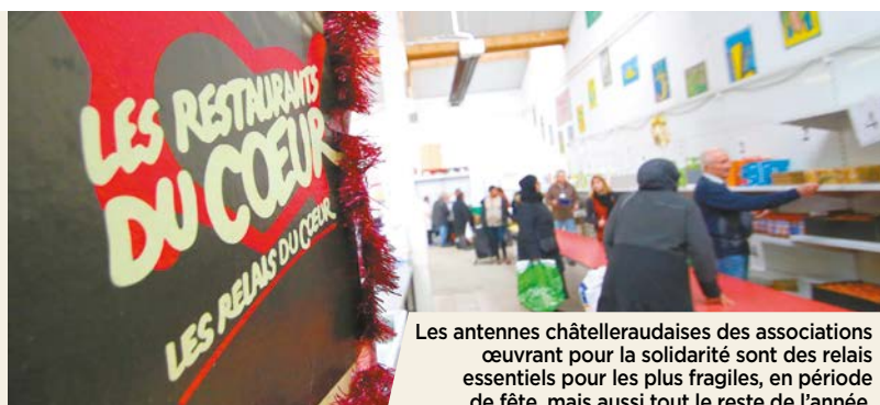
Les antennes châtelleraudaises des associations œuvrant pour la solidarité sont des relais essentiels pour les plus fragiles, en période de fête, mais aussi tout le reste de l'année.