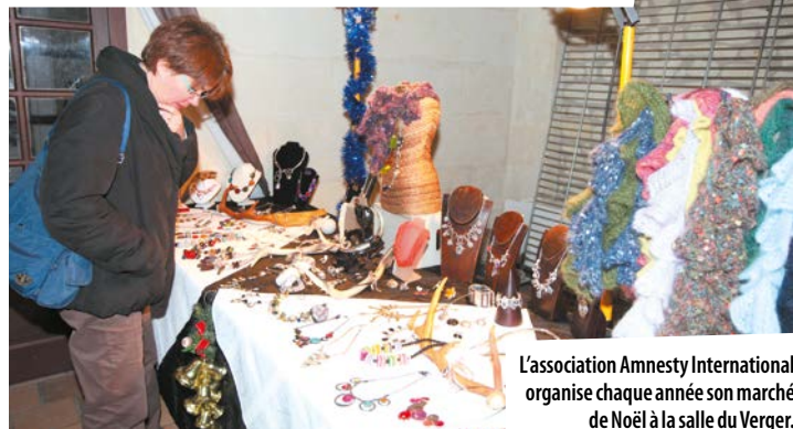
L'association Amnesty International organise chaque année son marché de Noël à la salle du Verger.