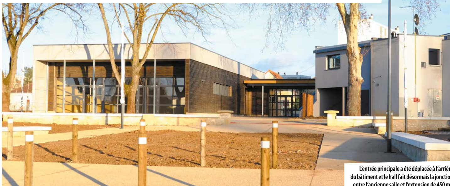
L'entrée principale a été déplacée à l'arrière du bâtiment et le hall fait désormais la jonction entre l'ancienne salle et l'extension de 450 m 2 .

Près d'un an de travaux aura été nécessaire avant la réouverture de la salle de la Gornière il y a tout juste quelques jours. Celle-ci sera inaugurée officiellement le 2 février.