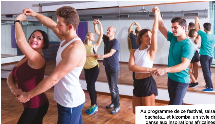
Au programme de ce festival, salsa, bachata... et kizomba, un style de danse aux inspirations africaines.