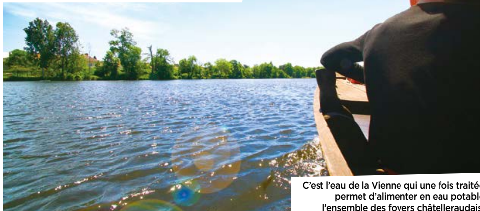
C'est l'eau de la Vienne qui une fois traitée permet d'alimenter en eau potable l'ensemble des foyers châtelleraudais.

(1) Après l'assainissement en 2002, la Ville avait confié en 2007 au syndicat la gestion et l'exploitation de la production et de la distribution d'eau potable.