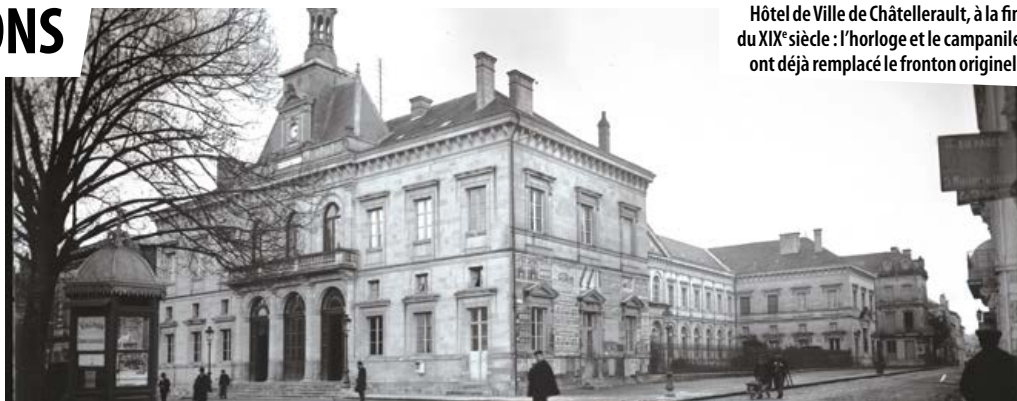
Hôtel de Ville de Châtelleraut, à la fin du XIX e siècle : l'horloge et le campanile ont déjà remplacé le fronton original.

Édifié à partir de 1848, l'Hôtel de Ville de Châtelleraut soufflera l'an prochain 170 bougies ! Les bâtiments qui composent cet édifice ne reflètent pourtant pas exactement le projet imaginé dès 1844 par l'architecte du département Jean Dulin : depuis la fin du XIX e siècle, les locaux n'ont cessé d'évoluer pour répondre aux exigences et aux besoins des municipalités successives.