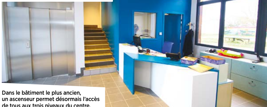
Dans le bâtiment le plus ancien, un ascenseur permet désormais l'accès de tous aux trois niveaux du centre.

La Ville a engagé d'importants travaux de rénovation dans les locaux mis à disposition du centre social des Minimes, réalisés en partie par le chantier d'insertion des Minimes. Engagée dans une démarche de développement durable et de mise en accessibilité des bâtiments publics, la Ville a souhaité réaliser une amélioration importante de la performance énergétique du centre, mais aussi offrir un meilleur accueil aux habitants du quartier en rendant notamment les locaux accessibles aux personnes à mobilité réduite.