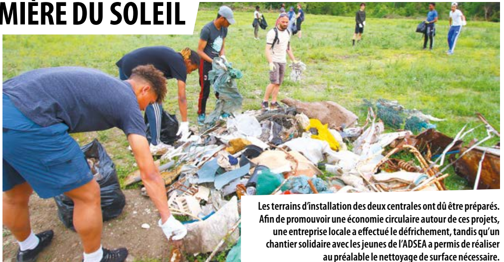
Les terrains d'installation des deux centrales ont dû être préparés. Afin de promouvoir une économie circulaire autour de ces projets, une entreprise locale a effectué le défrichage, tandis qu'un chantier solidaire avec les jeunes de l'ADSEA a permis de réaliser au préalable le nettoyage de surface nécessaire.

Une étude d'impact estime que la production de 420 tonnes de CO 2 sera évitée chaque année grâce à ce projet.