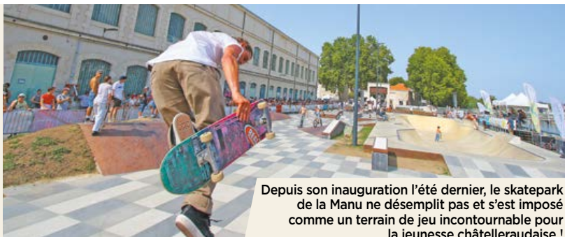
Depuis son inauguration l'été dernier, le skatepark de la Manu ne désemplit pas et s'est imposé comme un terrain de jeu incontournable pour la jeunesse châtelleraudaise !