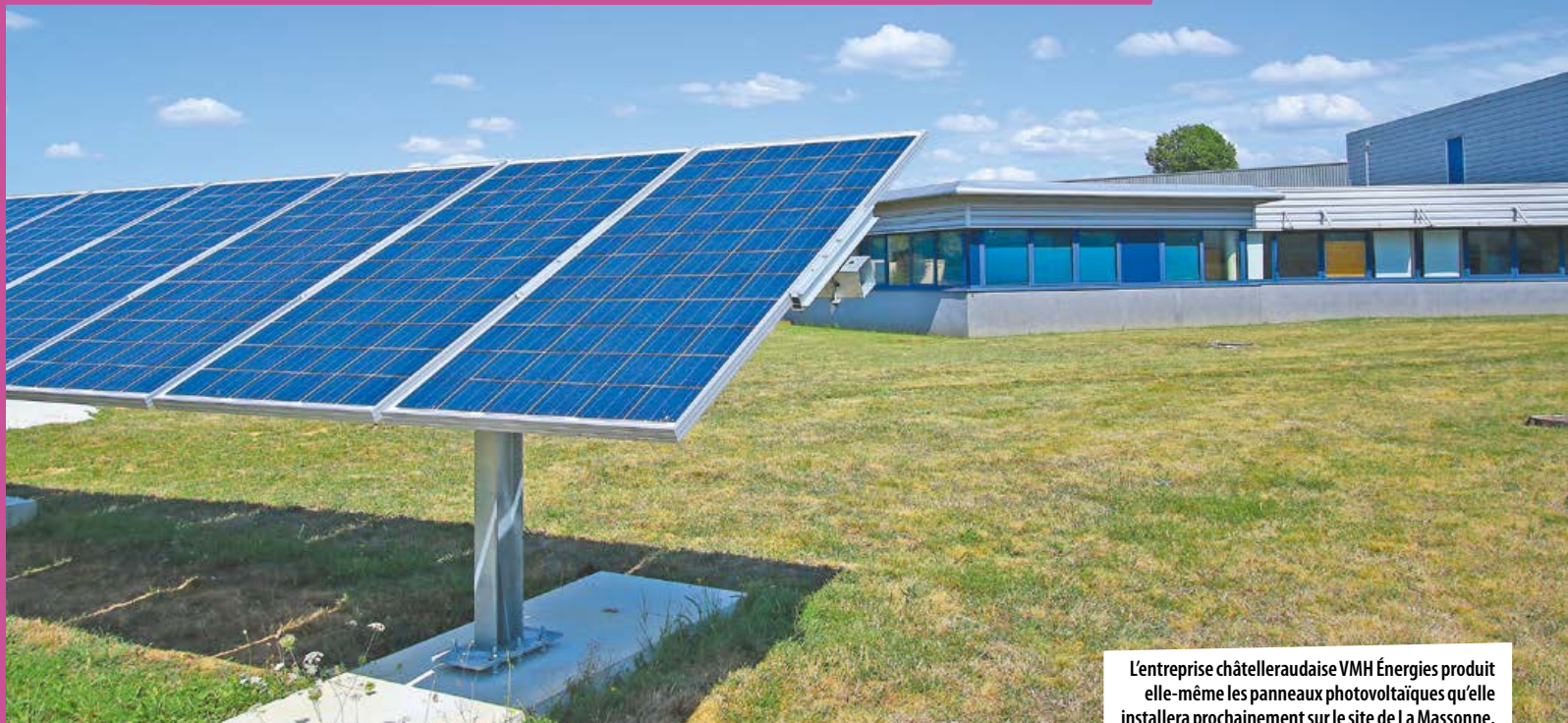
L'entreprise châtelleraudaise VMH Énergies produit elle-même les panneaux photovoltaïques qu'elle installera prochainement sur le site de La Massonne.