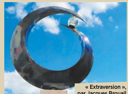
« Extraversion », par Jacques Brouail

Dans le numéro du Châtelleraudais du 15 au 31 octobre, une sculpture en photographie prise devant la patinoire de La Forge à la Manu