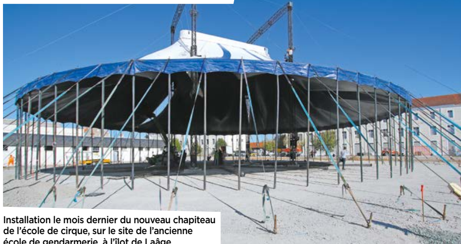
Installation le mois dernier du nouveau chapiteau de l'école de cirque, sur le site de l'ancienne école de gendarmerie, à l'îlot de Laâge.