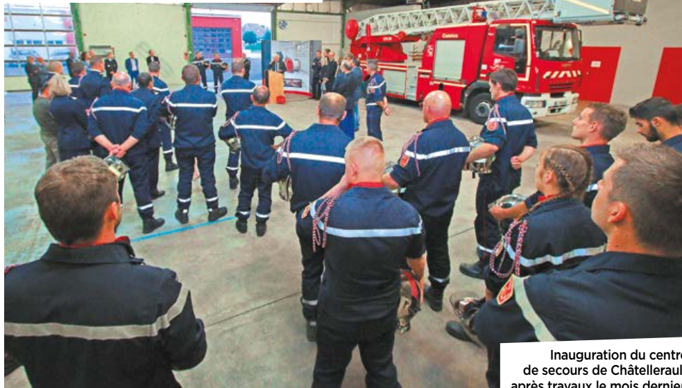
Inauguration du centre de secours de Châtelleraut après travaux le mois dernier.

(1) 1 CSP (Châtelleraut) et 4 Centres d'Incendie et de Secours (Ingrandes, Les Ormes, Dangé-Saint-Romain, Saint-Gervais-les-trois-clochers).