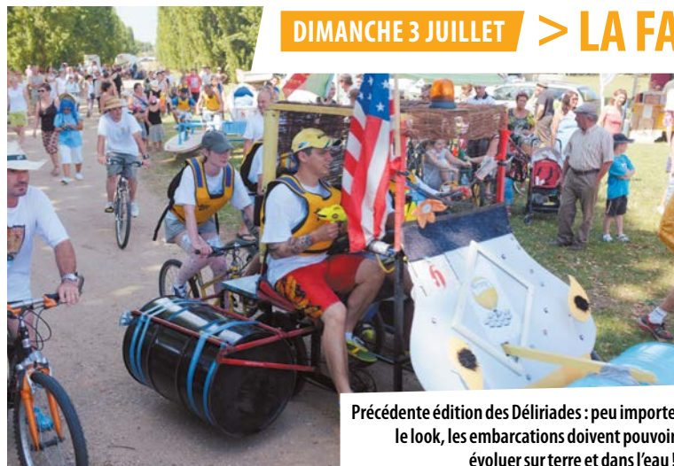
Précédente édition des Déliriades : peu importe le look, les embarcations doivent pouvoir évoluer sur terre et dans l'eau !

De petits changements peuvent naître de grands événements... Traditionnellement, la Fédération des Acteurs Économiques (FAE), l'association de commerçants du centre-ville, organisait en mai une journée festive, « La Vie en Rose ». Puis en été se déroulait la grande brocante de l'association sur les quais de Châteauneuf et dans les rues attenantes. Et depuis 20 ans, à la même époque, la Vienne devenait un terrain de jeu rafraîchissant pour les participants aux Déliriades... Cette année, les organisateurs de toutes ces animations se sont réunis sur une même journée !