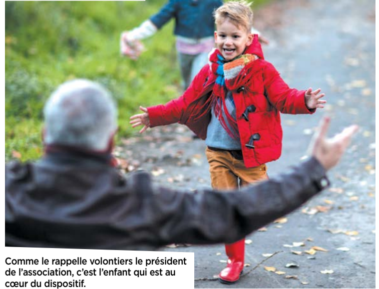
Comme le rappelle volontiers le président de l'association, c'est l'enfant qui est au cœur du dispositif.