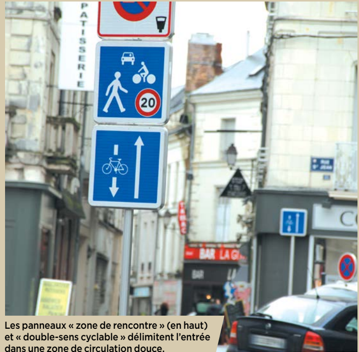
Les panneaux « zone de rencontre » (en haut) et « double-sens cyclable » délimitent l'entrée dans une zone de circulation douce.

La règle simple à retenir : c'est le piéton qui a priorité sur le vélo, lequel a priorité sur la voiture !