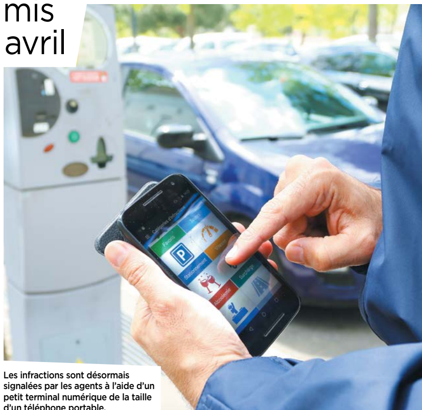
Les infractions sont désormais signalées par les agents à l'aide d'un petit terminal numérique de la taille d'un téléphone portable.