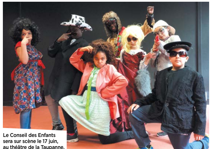
Le Conseil des Enfants sera sur scène le 17 juin, au théâtre de la Taupanne.

Les jeunes élus, formés par un animateur vidéo du « 4 », préparent aussi un DVD pour sensibiliser les habitants au tri sélectif. Les projets de la rentrée sont déjà dans les tuyaux : la création d'un jeu sur les enjeux de l'environnement, en partenariat avec la ludothèque et avec l'association « Les petits débrouillards », et la production d'un autre DVD sur la sécurité