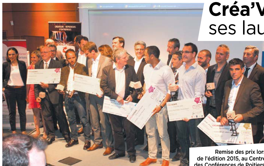
Remise des prix lors de l'édition 2015, au Centre des Conférences de Poitiers.