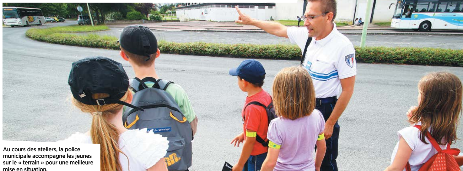
Au cours des ateliers, la police municipale accompagne les jeunes sur le « terrain » pour une meilleure mise en situation.

Dans le cadre de la réforme des rythmes scolaires (entrée en application à Châtellerauld lors de la rentrée de septembre 2015), un travail collaboratif a été mené pour offrir aux enfants des Ateliers de Découverte Educatifs (ADE), complémentaires aux activités et animations déjà proposées dans les accueils périscolaires. Et parmi les ateliers à succès, celui sur la