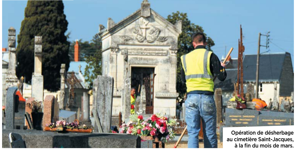
Opération de désherbage au cimetière Saint-Jacques, à la fin du mois de mars.

À Châtellerauld, cette diminution des traitements chimiques est assortie d'une vraie réflexion sur les solutions alternatives à appliquer. Le cas des cimetières est à cet égard emblématique. Une démarche qui prend en compte une dimension sociale. Le chantier d'insertion des Minimes et l'association Bio Solidaires ont ainsi été mis à contribution. Leurs bénéficiaires sont mobilisés quatre fois par an, pour réaliser un désherbage manuel, dans les inter-tombes et les petites allées. Une opération effectuée au moment des Rameaux et de la Toussaint, et courant juin. Des équipes de 6 à 8 personnes interviennent ainsi à chaque fois dans les six cimetières de la ville.