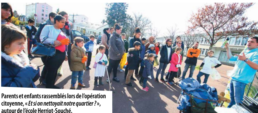
Parents et enfants rassemblés lors de l'opération citoyenne, « Et si on nettoyait notre quartier ? », autour de l'école Herriot-Souché.

Châtelleraud vient d'obtenir cette année la première étoile du label « éco-propre » créé par l'AVPU, l'Association des Villes pour la Propreté Urbaine. Cette récompense marque l'engagement de la Ville pour améliorer durablement la propreté de ses espaces publics : ce label valorisera au cours des cinq prochaines années, au fil de ses différentes étoiles (5 en tout), les moyens mis en œuvre pour diminuer la salissure, ainsi que la capacité à partager les évaluations et ces plans d'actions avec les habitants.