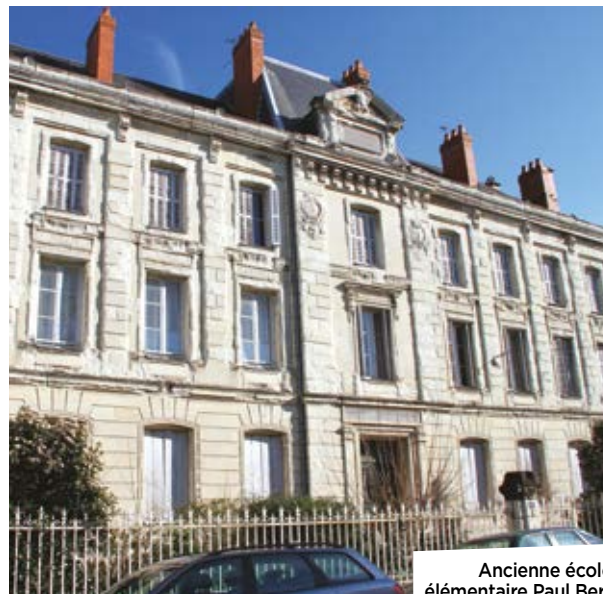
Ancienne école élémentaire Paul Bert