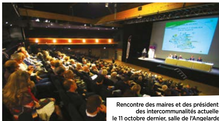
Rencontre des maires et des présidents des intercommunalités actuelles le 11 octobre dernier, salle de l'Angelarde.

Hôtel de Ville et de Communauté, 78 boulevard Blossac CS 90618 - 86106 Châtelleraut Cedex, 05 49 20 30 00, communication@capc-chatelleraut.fr