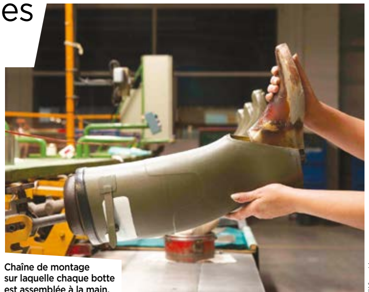
Chaîne de montage sur laquelle chaque botte est assemblée à la main.

Dernière usine de bottes en caoutchouc en France, Aigle Ingrandes résiste plutôt bien aux aléas du marché. « La qualité, le confort et la durabilité de nos produits sont reconnus. Nous proposons une gamme très large, tout public et qui répond à de nombreuses utilisations, du bord de mer à la moyenne montagne. » Les bottes représentent 25 % du chiffre d'affaires. Bourrées d'innovation, majoritairement fabriquées à la main, elles sont à l'image du savoir-faire artisanal qui a fait le succès de la marque. Une renommée qui dépasse les frontières hexagonales. Aigle réalise plus de 50 % de ses ventes à l'international.