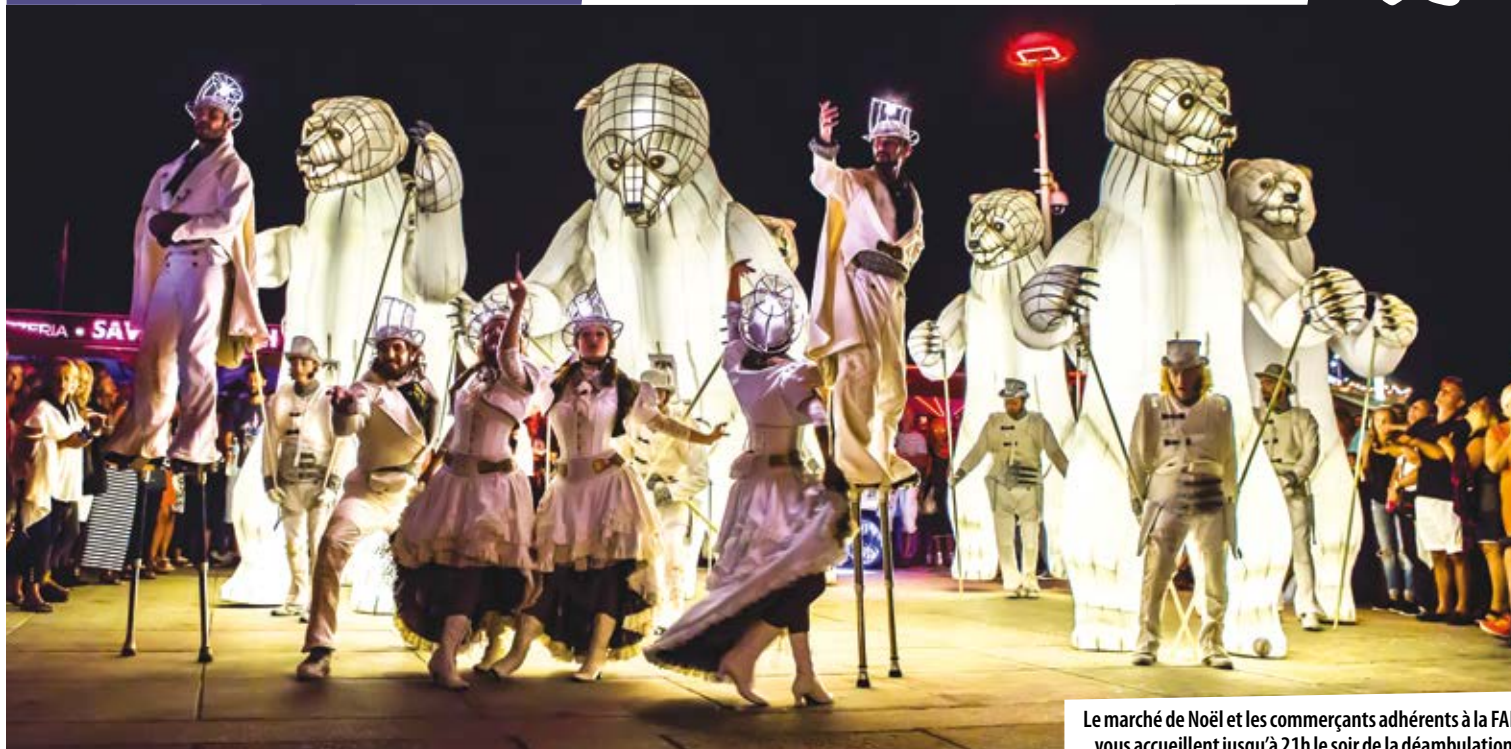
Le marché de Noël et les commerçants adhérents à la FAE vous accueillent jusqu'à 21h le soir de la déambulation.

Faites un merveilleux voyage dans le temps et suivez une harde d'ours lumineux, accompagnés d'extravagantes danseuses, guidés par un séduisant maître de cérémonie sur échasses. Suivez cette caravane de l'étrange qui s'invite comme au début du siècle dernier sur nos places publiques, où se côtoient crieurs de rue, colporteurs, vendeurs d'élixir, saltimbanques et montreurs d'ours pour nous offrir une délicate danse. Au milieu des géants fascinants, le rêve et l'étonnement seront au rendez-vous. Un ballet gracieux, une rencontre unique et improbable pour les petits et les grands. R.V. sur l'Esplanade François Mitterrand à 17h et 19h!