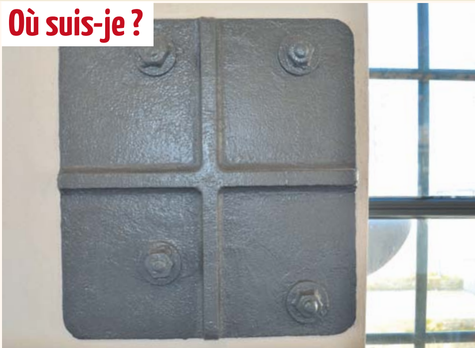
Vestige d'un ancien assemblage par « platine boulonnée », conservé lors de la réhabilitation de La Forge, et parfaitement visible derrière les gradins de la nouvelle boulonnerie inaugurée le mois dernier.