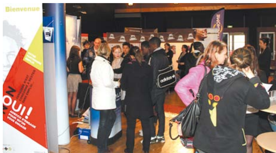
Lycéens en visite à la salle de l'Angelarde lors de l'édition 2014 du Printemps des Métiers.

L'équipe de la Maison de l'Économie, de l'Emploi et de la Formation (MEEF) , les services de l'Agglo de Châtellerauld, et leurs partenaires (1) , seront une nouvelle fois sur le pont pour que l'événement soit réussi. L'orientation professionnelle des jeunes et des adultes, ainsi que l'accès à l'emploi, aux jobs d'été et aux contrats en alternance, seront au cœur de cette cuvée 2015.