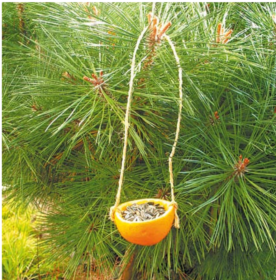
Le site www.par-ici-les-bons-gestes.fr propose également de nombreuses recettes et astuces « anti-gaspi », comme ces mangeoires à oiseaux faciles à réaliser : de quoi accueillir dans son jardin le retour printanier des petits migrants !